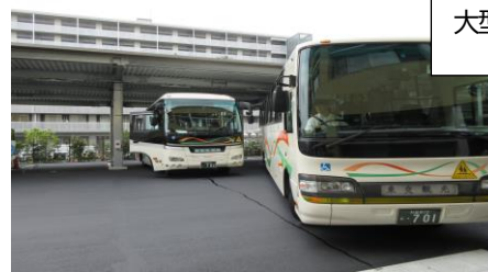
大型バスの入庫確認の様子

西棟の前の道路の交通量を鑑み、安全にスクールバスが運行するために、当面、教職員が誘導を行います。