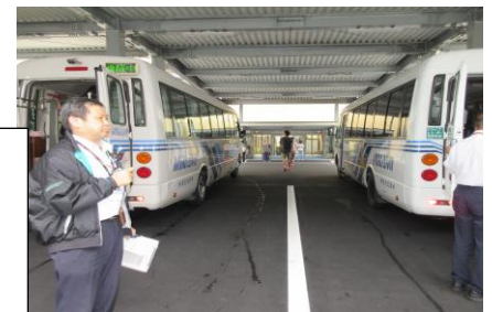
マイクロバスの間の中央通路の様子。先方は昇降口。