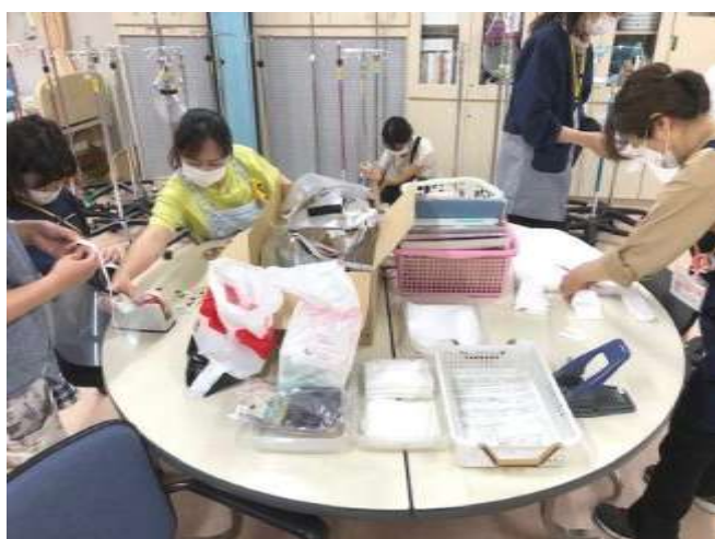
非常勤看護師によるフェイスシールドの作成