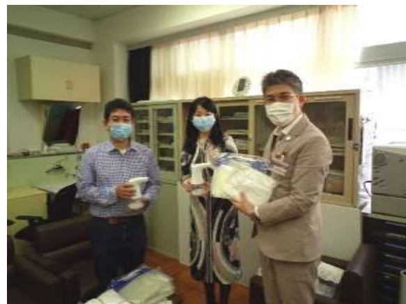
5月下旬第2回目の贈呈式の様子