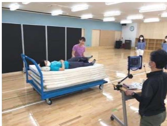
小学部 自立活動（身体の取り組み）