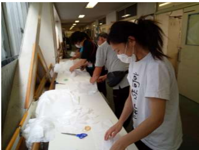
学校介護職員による簡易エプロン作成

光明学園では、6月からの分散登校に備えて様々な感染症対策を行っています。児童・生徒のみなさんが安心して学校に通うことができるように万全の対策を取っております。その一部を御紹介いたします。