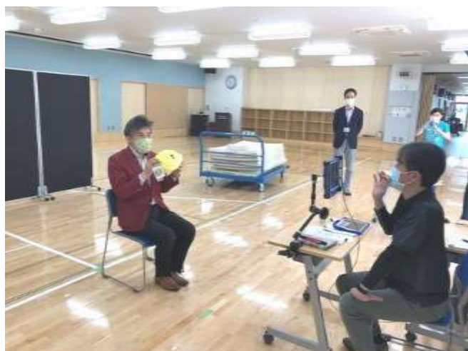
校長先生あいさつ

4日に1回の頻度で配信授業を行いました。2回目の配信からは、グループ別に教育課程ごとの配信を行いました。配信開始前のハロータイムには、配信している画面上に登場した児童・生徒の名前を教員が学校から大きな声で呼ぶと大きな声やアピールで返事をしている姿を見ることができました。YouTubeの配信ですと授業に対する反応を学校では見ることができませんが、ZOOMでは反応を見ることができると、授業を行う教員も配信授業に力が入り、様々な工夫や練習を念入りに行なって配信授業に臨んでいます。