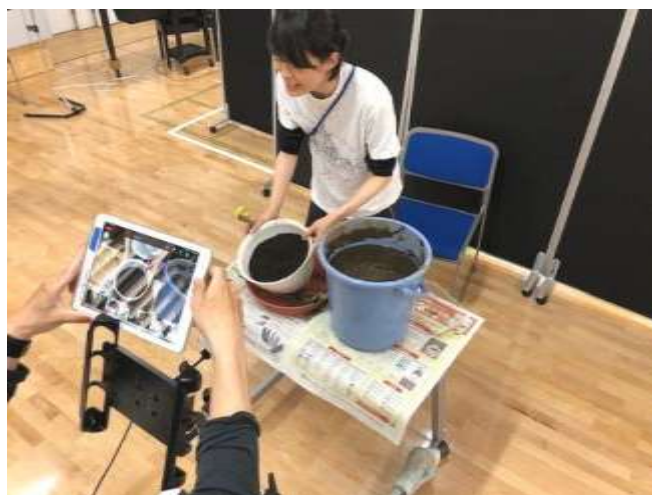
小学部 生活単元学習