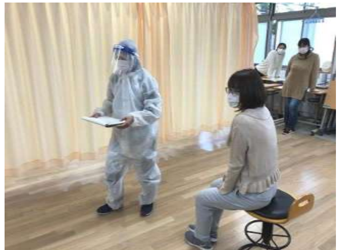
5月上旬にPTAから寄贈いただいた感染症対策資器材を用いた感染症対応訓練