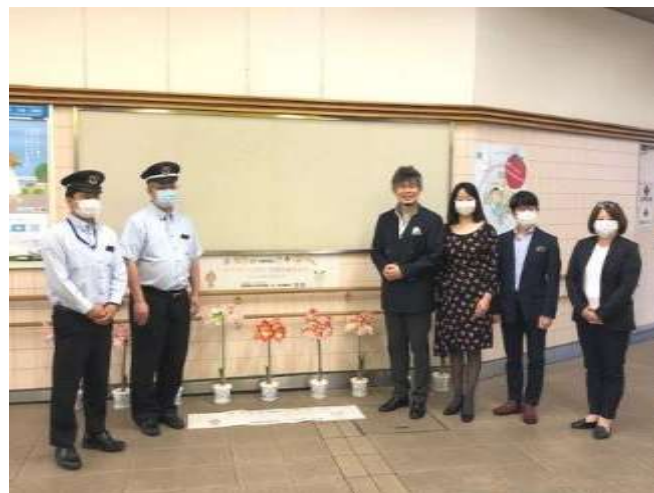
梅ヶ丘駅の皆様と記念撮影