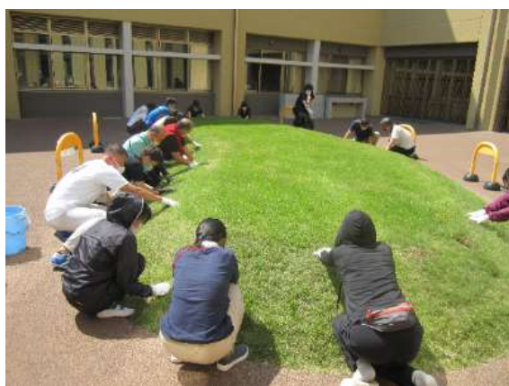
築山を整備する教職員

学校再開に向けて、学園生が少しでも安全な屋外で過ごしてほしいと思い、これまで築山は使用禁止にしていたのですが、芝生が定着しましたので6月から利用開始します。