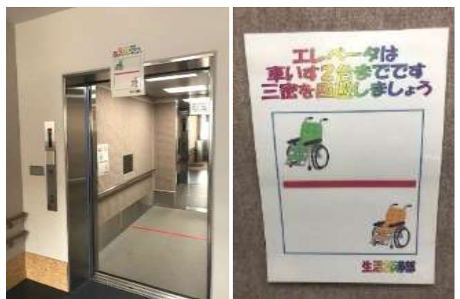
30人乗りの西棟エレベータは密集を防ぐために、ラインを引いて乗車人員を車いす2台とその介助者のみに限定しました。