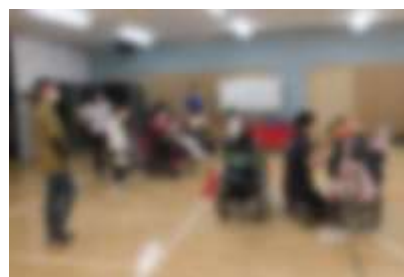
開会式練習の様子

スローガンは「明るく輝け 日々の成果 スマイル 光明祭」に決まり、今年度の「光明祭サンバ」にスローガンの言葉が取り入れられました。テーマソングはBTSの「ダイナマイト」に決まり、振りをつけて練習しています。