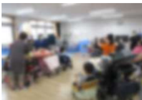
1年：国ごとの楽器の発表