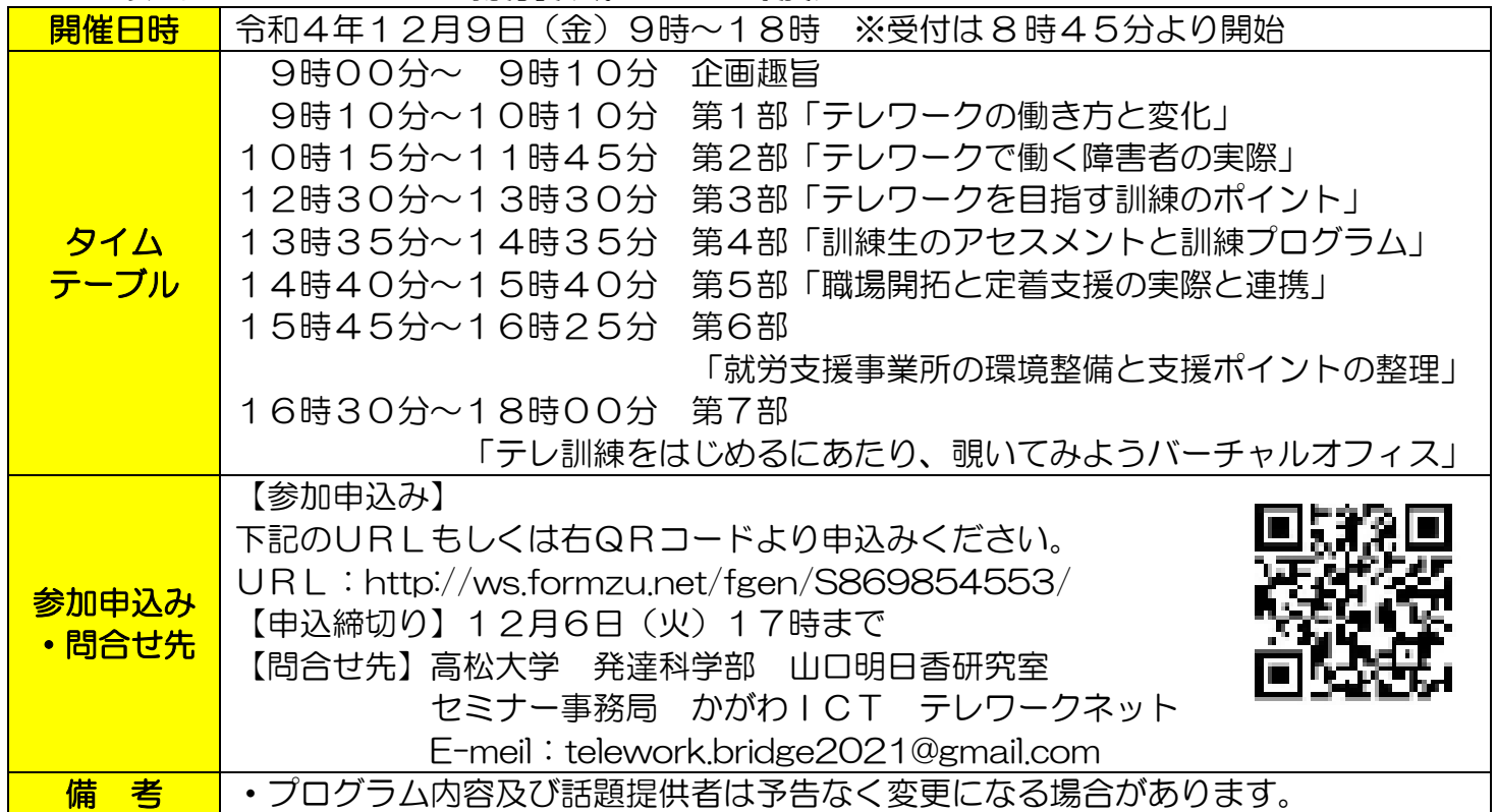
*表15:「テレワークによる就労」実践セミナーの概要*

障害のある人の新たな働き方として注目されています「テレワークによる就労」について理解を深め、障害のある方の「テレワークで働く」を視野に入れた様々な訓練の工夫や実践におけるポイントを紹介する実践セミナーが開催されます。この実践セミナーの概要は下表15を御確認ください。本セミナーは、オンライン・ウェビナーを使用し、参加無料です。興味のある方は表中のURLもしくはQRコードより参加申込みください。