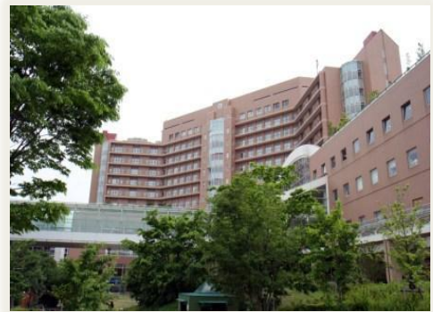
国立成育医療研究センター